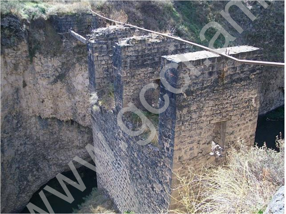
Պատկեր- Պասկեիչի կամուրջը վայրում

բնակչության զբաղվածության ապահովմանը, ինչպես նաև նպաստելու է գյուղատնտեսական տեղական արտադրանքի իրացմանը: Համալիրի տարածքի ընտրության հարցում հաշվի են առնվել քաղաքին մոտ լինելու, գյուղացիական տնտեսությունների ապրանքների վաճառքի համար բարենպաստ պայմանների առկայության, տեղի բնակչությանը սպասարկման աշխատանքներում հնարավորինս ներգրավելու հանգամանքները: Նախատեսված է համալիրը կառուցել Էկոլոգիապես մաքուր նյութերով, իսկ շահագործումն ապահովել արևային էներգիայով: Առաջիկայում ծրագիրը կներկայացվի ՀՀ կառավարության հաստատմանը, որից հետո մրցութային կարգով կընտրվի ծրագիրն իրականացնող կազմակերպությունը: